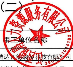
劳务派遣经营情况统计表(二)